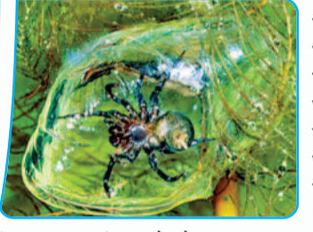
डाइविंग बेल स्पाइडर पानी के तल पर हवेली

डाइविंग बेल स्पाइडर पानी के तल पर हवेली यह दुनिया की एकमात्र ऐसी मकड़ी है, जो अपना पूरा जीवन पानी के नीचे बिताती है। यूरोप और एशिया के देशों में नदी-तालाबों के तल पर रहने वाली इस मकड़ी के द्वारा बनाई गई 'पानी के नीचे की हवेली' की तकनीक किसी चमत्कार से कम नहीं लगती है। यह मकड़ी पानी के नीचे पौधों के बीच रेशम का एक जाल बुनती है। फिर वह सतह पर जाकर अपने शरीर के पिछले हिस्से और पैरों पर लगे घने बालों की मदद से हवा का एक बुलबुला फंसाकर नीचे लाती है। इस हवा को वह अपने जाल के नीचे छोड़ देती है, जिससे वह एक बेल (घंटी) की तरह फूल जाता है। यह बुलबुला एक 'फिजिकल गिल' की तरह काम करता है। यह पानी से ऑक्सीजन सोखता है और कार्बन डाई-ऑक्साइड को बाहर निकालता है। इस वजह से मकड़ी को बार-बार हवा लेने के लिए सतह पर नहीं जाना पड़ता। इसी हवा भर बुलबुले के अंदर यह मकड़ी सोती है, खाना खाती है और अंडे देती है। उसका यह घर तैरकर ऊपर न चला जाए, इसके लिए वह इसे रेशमी धागों से जलीय पौधों से मजबूती से बांध देती है। शिकार करने के लिए यह मकड़ी बस अपने पैरों को बुलबुले से बाहर निकालती है और पास से गुजरने वाले कीड़ों को पकड़ लेती है। *