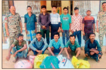
दबिशा दिय, जहाँ से एक जंगली भालू की सूखी खाल बरामद की गई, जिसकी अनुमानित कीमत लगभग एक लाख रुपये बताई जा रही है।