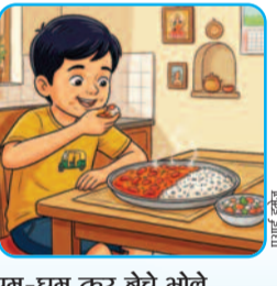
क्या कहने चावल के

कविता / शादाब आलम क्या कहने चावल के क्या कहने चावल के माई कम रे, जितनी करो बड़ाई। इसे दूध के साथ मिलाकर मजा बहुत आता है खाकर। अगर राजमा चावल पाऊं तीन प्लेट भरकर मैं खाऊं। बने पुलाव जब घर में अपने कोना-कोना लगे मटकने। कढ़ी और चावल की जोड़ी नहीं किसी ने अब तक तोड़ी।