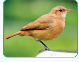
रूफस हॉनेरो मिट्टी के ओवन जैसा घोंसला

रूफस हॉनेरो मिट्टी के ओवन जैसा घोंसला दक्षिण अमेरिका में पाया जाने वाला पक्षी रूफस हॉनेरो, अपने मिट्टी से बने घर के निर्माण के लिए प्रसिद्ध है। बच्चों, इस पक्षी को कलाकारी देखकर तुम दंग रह जाओगे। रूफस कीचड़, गोबर और सूखी घास को मिलाकर एक गोल घर बनाता है। इसका आकार पुराने जमाने के मिट्टी के ओवन जैसा दिखता है, इसलिए इसे 'हॉनेरो' कहा जाता है। स्पैनिश में 'हॉनेरो' का मतलब ओवन होता है। जब यह मिट्टी का घोंसला धूप में सूखकर सख्त हो जाता है, तो यह कंक्रीट जैसा मजबूत हो जाता है। भारी बारिश और तेज हवाएं भी इसे नहीं तोड़ पातीं। यह घोंसला शिकारियों से सुरक्षा के लिए एक किले की तरह काम करता है। इसका द्वार भूल-भुलैया जैसा होता है। इसके घोंसले का दरवाजा सीधा अंदर नहीं खुलता। इसके अंदर एक घुमावदार दीवार होती है, जो अंग्रेजी अक्षर 'पी' आकार का रास्ता बनाती है। यह दीवार टंडी हवा को सीधे अंदर जाने से रोकती है। साथ ही सांपों जैसे शिकारियों के लिए बच्चों तक पहुंचने से सुरक्षित रखती है। रूफस हॉनेरो, अकसर बिजली के खंभों, ऊंचे पेड़ों या इमारतों के कोनों पर अपना घर बनाते हैं। *