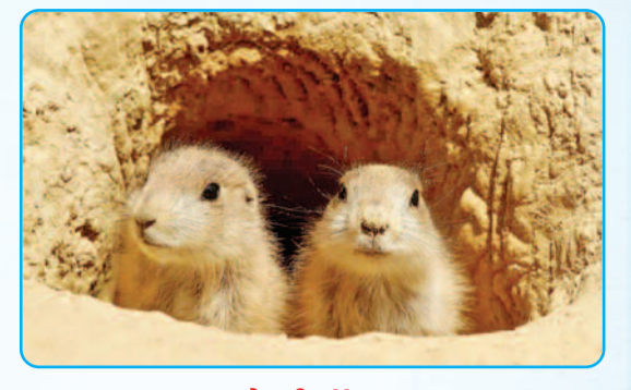
प्रेयरी डॉग्स जमीन के भीतर अंडरग्राउंड सिटी

बच्चों, कुछ जीव-जंतु अपने रहने के लिए ऐसे आवास बनाते हैं, जिन्हें देखकर तुम दंग रह जाओगे! तुम यही सोचोगे कि इन्होंने इतनी अमेजिंग होम मेकिंग इंजीनियरिंग आखिर सीखी कहां से? जानो, ऐसे ही कुछ जंतुओं के अनोखे घरों के बारे में।