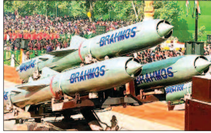
मिलियन डॉलर यानी 3,800 करोड़ रुपए है। इंडोनेशिया ने कहा कि यह सौदा उसके हथियारों के आधुनिकीकरण और तटीय सुरक्षा क्षमता को मजबूत करने की रणनीति का हिस्सा है।

रिपोर्ट के मुताबिक, ब्रह्मोस मिसाइल को लेकर भारत-इंडोनेशिया के बीच हुई इस डील की कीमत 450