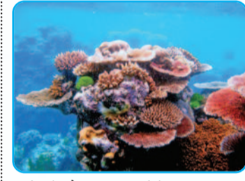
कोरल पॉलिप्स विशाल-मजबूत कॉलोनियां

कोरल पॉलिप्स विशाल-मजबूत कॉलोनियां कोरल पॉलिप्स, समुद्र के वे अदृश्य कलाकार होते हैं, जो दुनिया की सबसे बड़ी और सुंदर जीवित प्रवाल भित्तियां (कोरल रीफ) बनाते हैं। यह किसी चमत्कार से कम नहीं है कि चावल के दाने जितने छोटे जीव अंतरिक्ष से दिखने वाले ऊंचे 'पहाड़' खड़े कर देते हैं। प्रत्येक कोरल पॉलिप्स अपने चारों ओर कैल्शियम कार्बोनेट (चूना पत्थर) का एक कठोर कवच बनाता है। जब वे पॉलिप्स मर जाते हैं, तो उनके कठोर कंकाल वहीं रह जाते हैं, और नए पॉलिप्स उनके ऊपर अपना घर बनाना शुरू कर देते हैं। हजारों सालों की इस प्रक्रिया से विशाल कोरल रीफ का निर्माण होता है। *