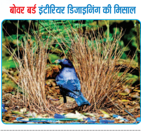
बोवर बर्ड इंटीरियर डिजाइनिंग की मिसाल

ऑस्ट्रेलिया और न्यू गिनी में पाए जाने वाले बोवर बर्ड का अपना घर बनाने का तरीका बड़ा ही अनोखा होता है। बोवर बर्ड अपना बोवर यानी घर बनाने के साथ-साथ उसमें इंटीरियर डिजाइन भी करता है। उसे सजाता है, संवारता है। दिलचस्प बात यह है कि यह बोवर इनका असली घोंसला या आवास नहीं होता है। मादा पक्षी अंडे देने के लिए अलग घोंसला बनाती है। नर बोवर बर्ड, यह सुंदर महलनुमा घर केवल मादा को प्रभावित करने के लिए बनाता है। नर पक्षी टहनियों को जमीन में गाड़कर दो समानांतर दीवारें बनाता है, जो एक गलियारे जैसी दिखती हैं। बोवरबर्ड को कुछ प्रजातियां तो टहनियों से